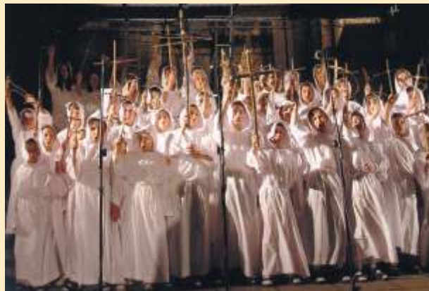
Widowisko plenerowe “Rzecz o Franciszku”

www.gaudemater.pl, e-mail: biuro@gaudemater.pl