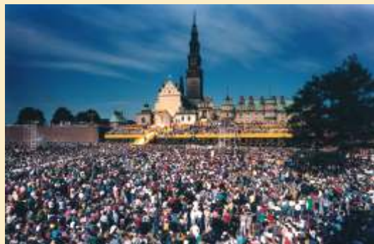
Uroczystości pod Szczytem Jasnogórskim

Król Jan Kazimierz w Ślubach Lwowskich ogłosił Matkę Boską Królową Polski. Fortyfikacja wytrzymała oblężenia szwedzkie w okresie wojny północnej w 1702, 1704 i 1705 roku. W 1717 roku przeprowadzono pierwszą na ziemiach Polski koronację obrazu Czarnej