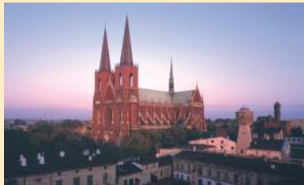
Archikatedra pw. św. Rodziny

Złota Góra (poza mapką) - wapienne wzniesienie na Szlaku Orlich Gniazd, ułożone przeciwległe do Jasnej Góry. Z tego miejsca rozciąga się niezapomniany widok - panorama na całą Częstochowę. Wapień był swego czasu bardzo popularnym materiałem budowlanym, a z wydobytego tutaj kamienia powstało wiele częstochowskich budynków. Obecnie wyrobiska są już nieczynne i stanowią swoistą atrakcję turystyczną.