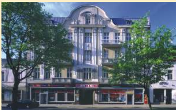
Jedna z kamienic w Alei Najświętszej Maryi Panny