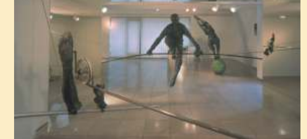
Unikatowe „rzeźby balansujące” Jerzego Kędziory

Ekspozycja stała zabytkowego sprzętu i wyposażenia kolejowego. Dworzec PKP Częstochowa Stradom, ul. Pułaskiego 100/120, tel.+48 34/ 363 59 31, 322 26 89, www.ipkww.one.pl czynne: wtorek, czwartek, sobota 10.00 - 13.00 inne terminy po wcześniejszym ustaleniu