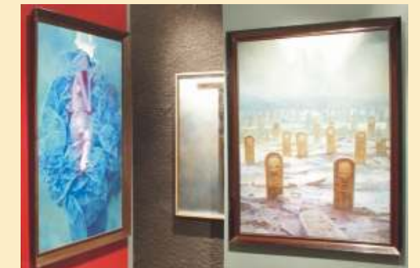
Kolekcja dzieł Zdzisława Beksińskiego

Jasnogórskie Centrum Informacji (A/B-4) , ul. Kordeckiego 2, tel.+48 34/ 365 38 88 www.jasnagora.pl, e-mail: jci@jasnagora.pl