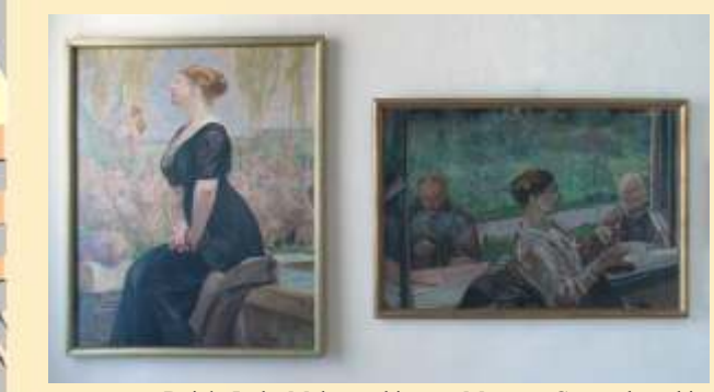
Dziela Jacka Malczewskiego w Muzeum Częstochowskim

Muzeum Archidiecezji Częstochowskiej (A/B-6) Zbiory muzeum stanowią zabytki sztuki sakralnej z Częstochowy i okolic powstałe w różnym czasie, mające wartość nie tylko artystyczną, ale także historyczną i kulturową. Wśród rzeźb wyróżnić należy Matkę Bożą z Dzieciątkiem z ok. 1430 r., figury Chrystusa czy postaci świętych takie jak: św. Marcin ze Mstowa z ok. 1500 r., czy św. Joachim z połowy XVIII w. Kompozycje malarskie to w większości obrazy przedstawiające świętych bliskich polskiej duchowości religijnej, m.in. św. Anne, św. Antoniego Padewskiego, św. Rocha i św. Sebastiana, św. Pawła Pustelnika oraz sceny z życia Chrystusa i wizerunki Matki Bożej. Ciekawą częścią zbiorów są numizmaty oraz medale wydawane z okazji różnych wydarzeń kościelnych i uroczystości religijnych - stanowiące swoistą historię Kościoła. ul. św. Barbary 41, tel.+48 34/ 368 33 61 czynne: wtorek - sobota 9.00 - 13.00